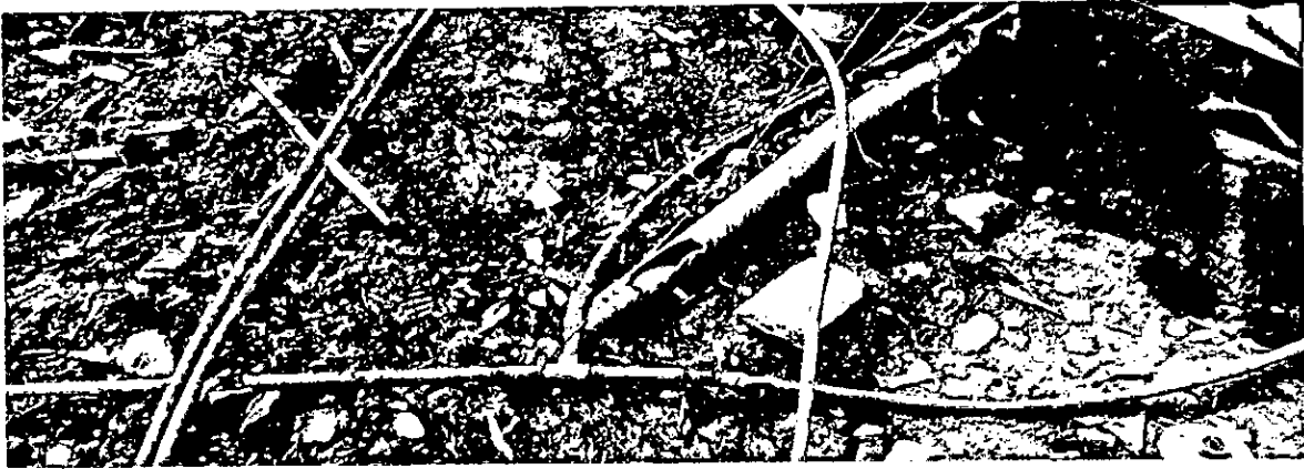
Tubos en mal estado de la explotación de cerdos