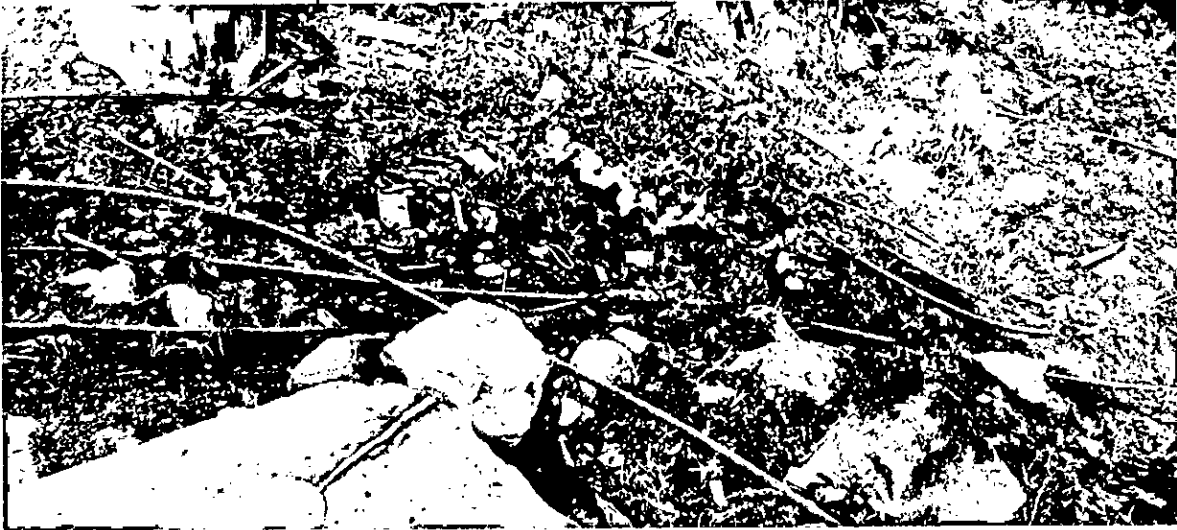
Manguera a libre flujo