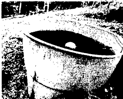
Imagen 3. Tanque de almacenamiento

El interesado implementó en su predio tanque de almacenamiento de 750L dotado con dispositivo de control de flujo.