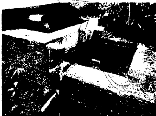
Imagen 1. Obra de captación y control de caudal. 1

El usuario no ha entregado a la corporación de los diseños requeridos y en la vista se evidenció que la obra implementada no garantiza la derivación del caudal otorgado, ya que el tubo no sale de la caja 1 a la 2 sino que está ubicado directamente en la caja 1, se realizó aforo volumétrico en el tubo de entrada a la caja 1, el cual arrojó un caudal de 0.320L/seg. Sin embargo no se pudo realizar el aforo en la obra de control (caja 2) puesto que no tenía tubería que lo permitiera, por lo que no fue posible verificar si se está captando o no el caudal otorgado por la Corporación que para Nevardo Mejia es de 0.0047L/seg y para Alfonso Mauricio Murillo es de 0.004L/seg.