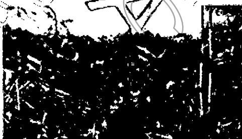
Área de tala (Aproximadamente 2.5 hectáreas)