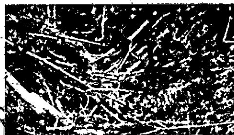
Residuos vegetales sobre la fuente de agua superficial