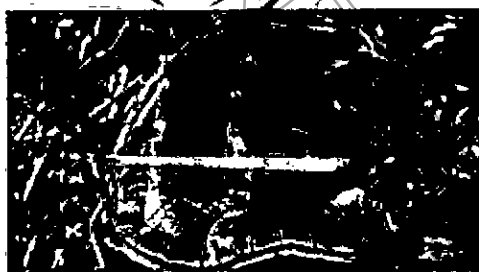
Tocón basal de árbol aserrado.