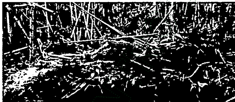
Guadual cortado a tala rasa para adecuación de terreno para potreros