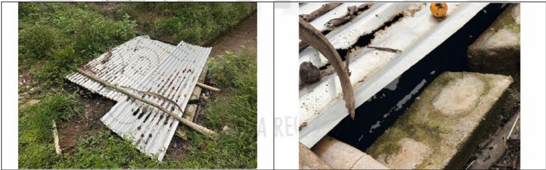
Imagen 2. Tanque con agua estancada.

Por otra parte, Dentro del predio del señor Nelson Eduardo Velásquez Cortés, se evidencia un tanque con agua estancada, presuntamente de actividad de lavado de piel, cuya instalación visiblemente se ve sin mantenimiento y carente de un buen sistema de flujo de agua.