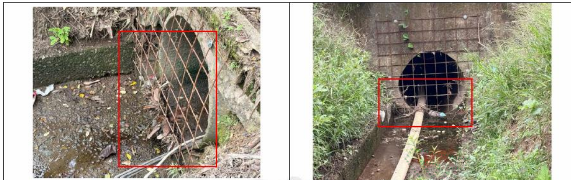
Imagen 3 - Mantenimiento y limpieza del sistema de desagua o drenaje vial

En las coordenadas -74^{\circ} 50' 7.22'' 6^{\circ} 29' 53.20'' , se evidencia la obstrucción del flujo de las aguas negras generado por las 4 viviendas de las señoras Rúa Duque.