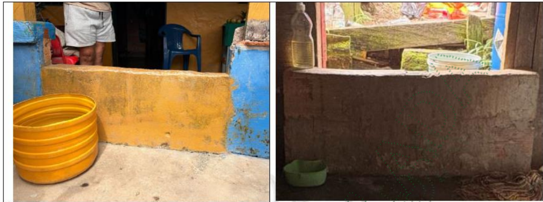
Imagen 5. Muros levantados.