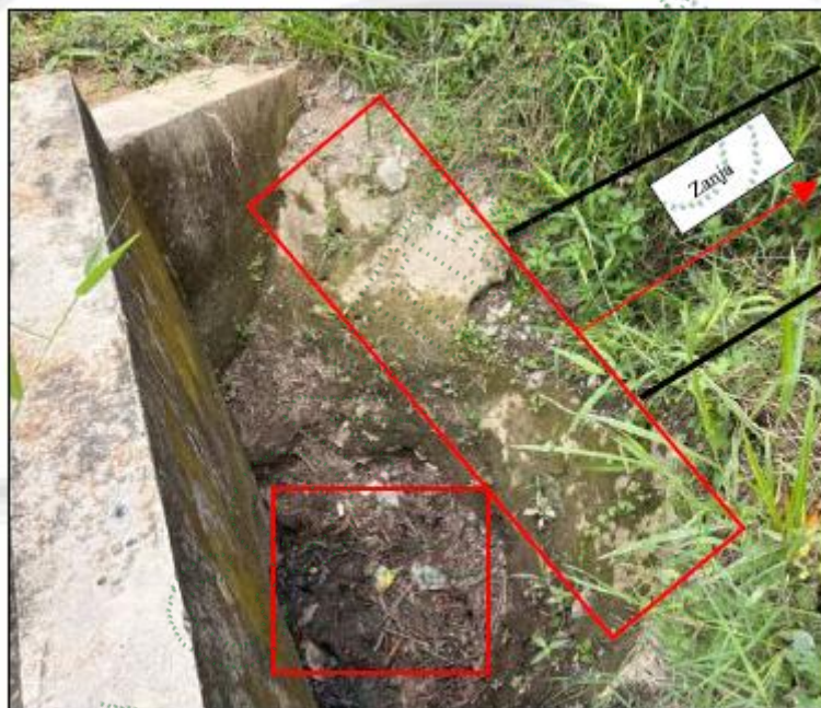
Imagen 4. Obstrucción del flujo de aguas negras.

En las coordenadas -74^{\circ} 50' 7.22'' 6^{\circ} 29' 53.20'' , se evidencia la obstrucción del flujo de las aguas negras generado por las 4 viviendas de las señoras Rúa Duque.