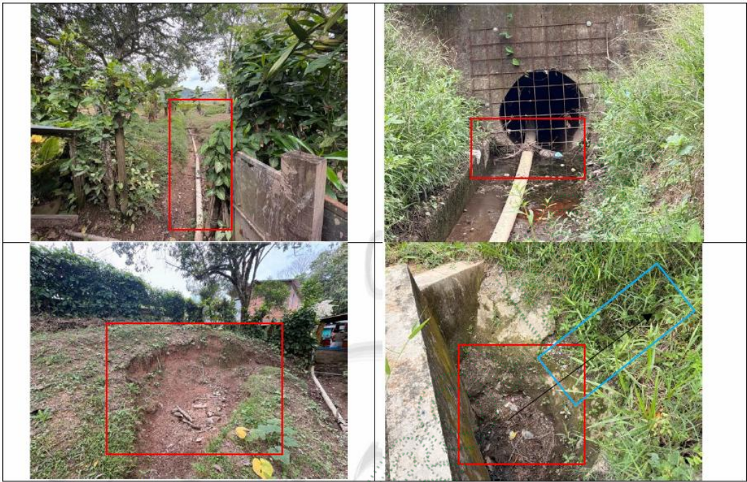
Imagen 1 – Tubería que conduce las aguas domesticas del predio.

Duque son adultas mayores y tienen algunas limitaciones (discapacidad), lo que aumenta su vulnerabilidad frente a esta situación.