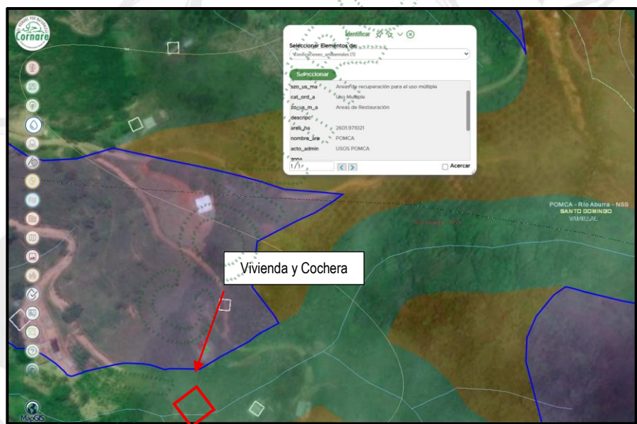
Tabla 2. Cornare. 2025. Descripción de las subzonas de uso y manejo en las que se encuentran los predios de los presuntos infractores conforme al POMCAS del Río Aburrá.