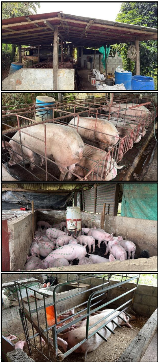
Imagen 3. Cornare. 2025. Corrales y jaulas presentes en el galpón 1 construido por el señor Fabio Ochoa.