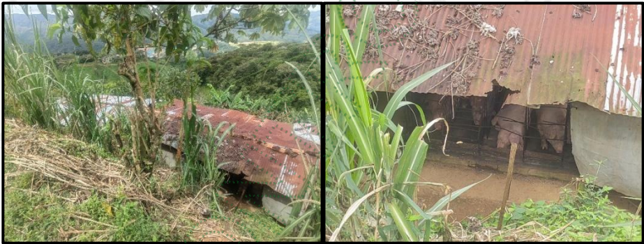
Imagen 5. Cornare. 2025. Galpón 3 dentro de la propiedad del señor Fabio Ochoa.