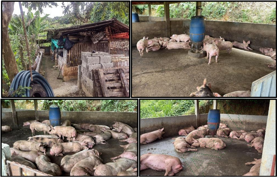
Imagen 4. Cornare. 2025. Corrales construidos en el galpón 2 dentro de la propiedad del señor Fabio Ochoa.