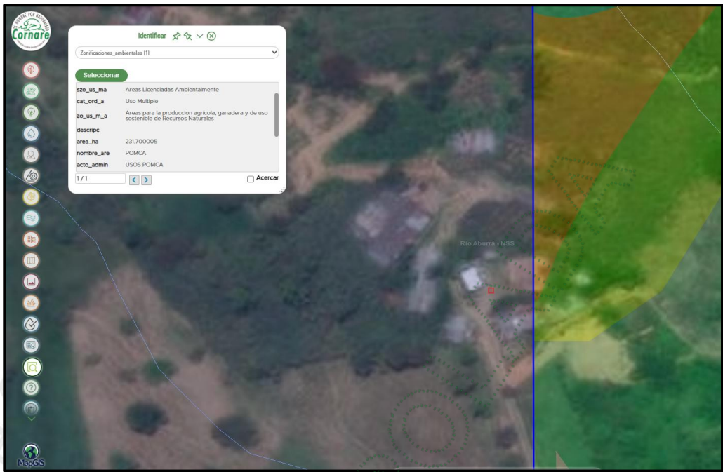
Imagen 8. MapGIS Cornare. 2025. Zonificación ambiental aplicada al predio del señor Fabio Ochoa.