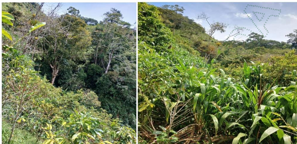
Imagen 2 estado actual del predio

Para finalizar, no puede desconocer este despacho lo evidenciado en campo el día 26 de julio de 2024, por parte del equipo técnico de la Corporación, en el ejercicio de sus facultades de control y seguimiento, que generó el Informe Técnico N° IT-05078-2024 del 05 de agosto del 2024, donde se evidencia la suspensión de las actividades de aprovechamiento forestal, en atención a la medida preventiva impuesta, además de un proceso de regeneración natural en el predio, como se muestra: