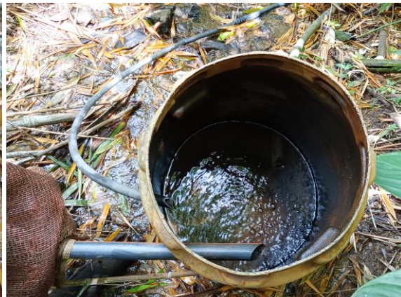
Tanque de almacenamiento