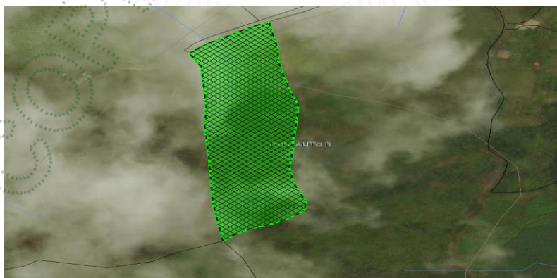
Imagen 1: Ubicación del predio.