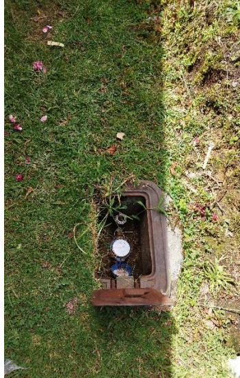
Contador de agua de la vivienda del señor Octavio Vera, con conexión a acueducto veredal