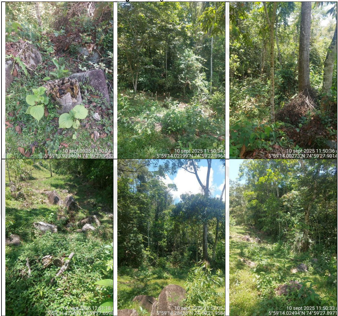
Figura 2. Regeneración natural