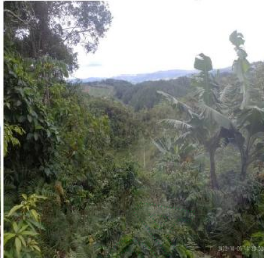
Fotografía actual del predio.