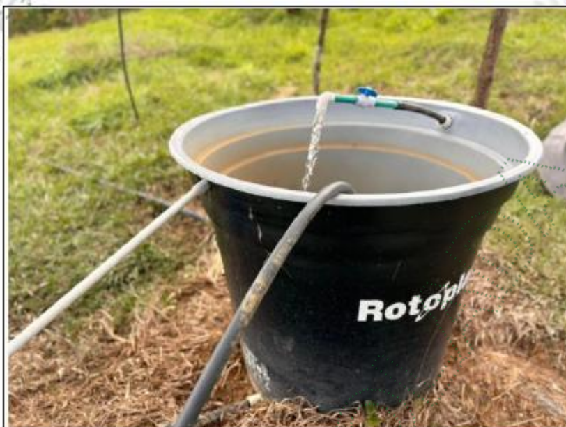
Imagen 2. Agua de un usuario sin afectaciones.

Se verificó en viviendas que el recurso hídrico aprovechado no tiene características o en su defecto indicadores físico que indican que el agua está siendo contaminada por condiciones no comunes.