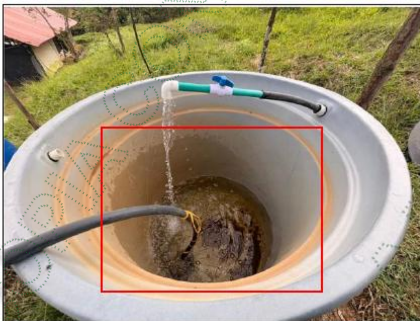
Imagen 3. Observación de parámetros físicos del agua.

Se verificó en viviendas que el recurso hídrico aprovechado no tiene características o en su defecto indicadores físico que indican que el agua está siendo contaminada por condiciones no comunes.