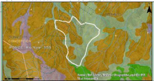
Imagen 3. Zonificación ambiental – Geo portal

En groso modo analizando las determinantes ambientales de esta área de interés, abarcando el predio del señor Ivan Darío Cardona, identificado con C.C 98.473.535 , se determina que :