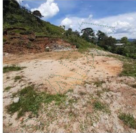
Fotografías 1 y 2. En ellas se evidencia la explanación N 1.

Explanación 2: se ubica entre las coordenadas: -75^{\circ}7'33.20'' W, 6^{\circ}21'59,00'' N; -75^{\circ}7'32.80'' W, 6^{\circ}21'58,80'' N; -75^{\circ}7'32.60'' W, 6^{\circ}21'58,60'' N; -75^{\circ}7'32.60'' W; 6^{\circ}21'58,30'' N, -75^{\circ}7'33.10'' W; 6^{\circ}21'58,60 y -75^{\circ}7'33.40'' W; 6^{\circ}21'59,00 ubica en la baja de la explanación 1; dicha explanación cuenta con un área de 287 m 2 . De acuerdo con lo informado en campo, las actividades se realizaron hace aproximadamente dos (2) años.