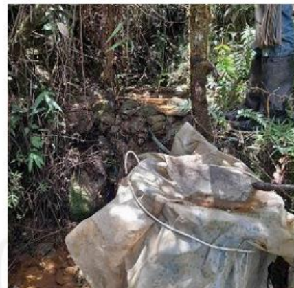
Fotografías 6. Obra de captación de la señora Ilda Luz Muñoz