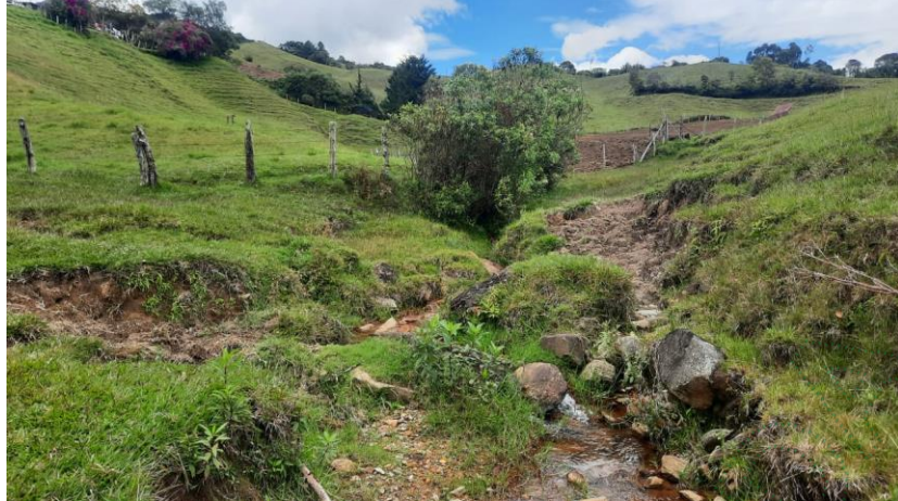
Fuente Miguel sin buena cobertura vegetal