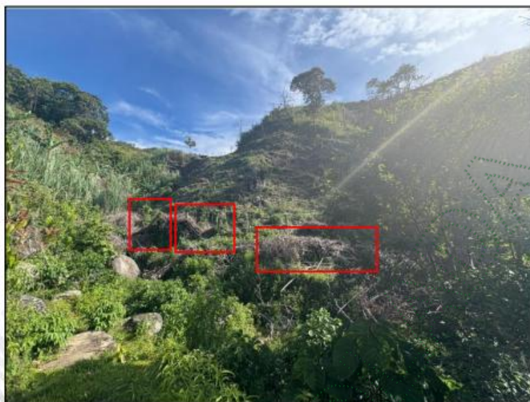
Imagen 4. Biomasa en pila.

Se observó la presencia de agua en la quebrada Cantayus, así como pilas de biomasa acumuladas en sus márgenes y sobre el curso del afluente. Ante esta situación, se procedió a emitir una recomendación verbal al responsable, indicando lo siguiente: "Disponer adecuadamente, o en su defecto, reubicar a una distancia prudente las pilas de biomasa que se encuentran tanto sobre el cauce como en los bordes de la quebrada." Esta medida busca prevenir posibles arrastres o afectaciones al recurso hídrico en caso de lluvias intensas, contribuyendo así a la protección de la quebrada y al cumplimiento de buenas prácticas ambientales.