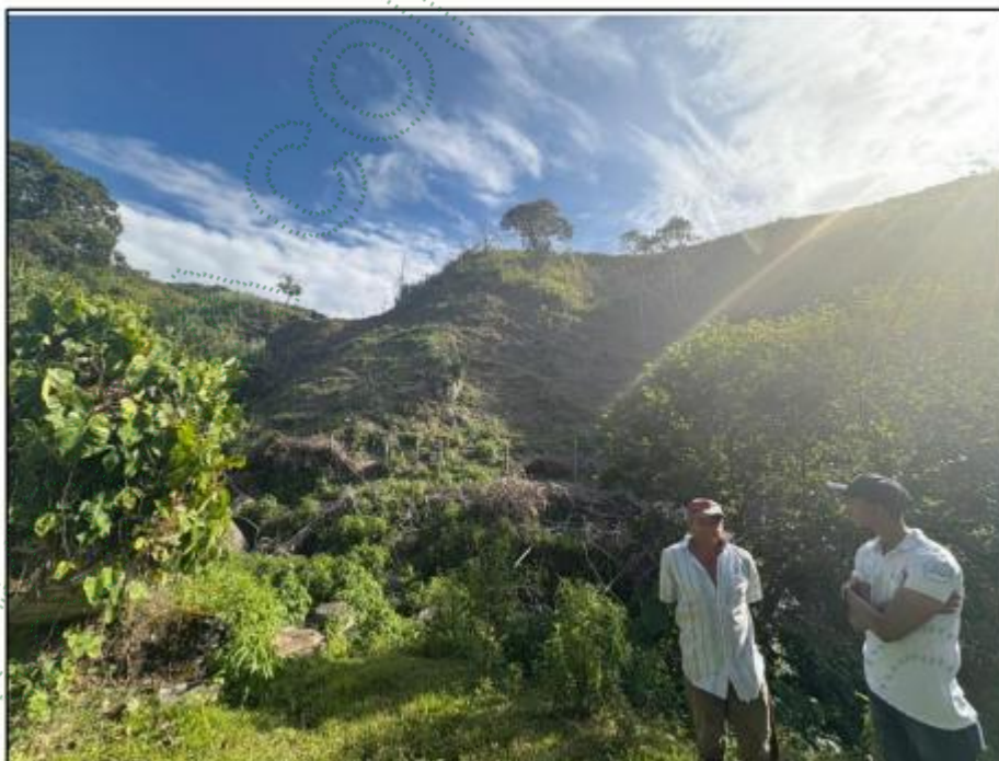
Imagen 2. Conversación en campo con el presunto infractor.

La vivienda se encuentra ubicada en el municipio de Santo Domingo – Antioquia – Vereda La palma parte alta, con frontera de la vereda – Cantayus con las siguientes coordenadas -75^{\circ}2'24'' – 6^{\circ}31'11'' 1368 msnm, durante la visita se pudo identificar la proximidad que tiene el predio del señor Octavio de