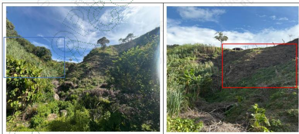
Imagen 3. Zona de influencia de la queja ambiental - 2023

En el lugar se constató que la actividad ha sido suspendida desde que CORNARE emitió la notificación correspondiente. Asimismo, se observó la presencia de material vegetal de color café oscuro, el cual presenta características propias de biomasa expuesta al sol, sin evidencia de intervención reciente, por otra parte, se evidencia cultivo de caña, que es de subsistencia y que ha estado antes de la intervención que generó la queja ambiental.