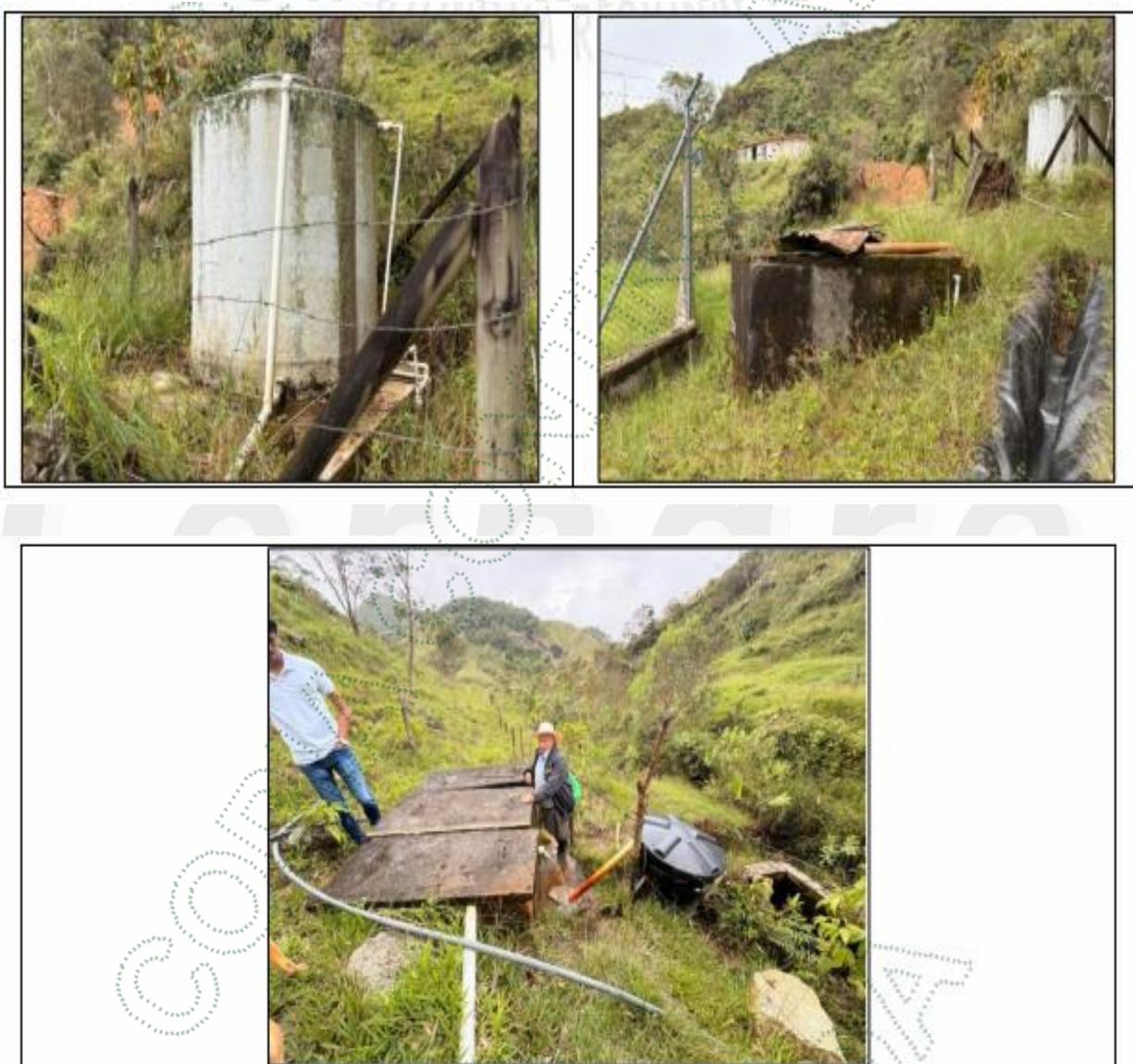
Imagen 1. Tanque de Almacenamiento y punto de captación.