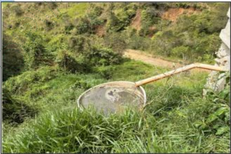
Imagen 3. Tanque para la porcinaza liquida.

Se conversó con el señor Andrés Cortez Montoya, Encargado de la producción. Nos comenta que la porcinaza liquida, es recolectada en un tanque de 2.000 L de material plástico, y hacen riego a pasto por las horas de la tarde.