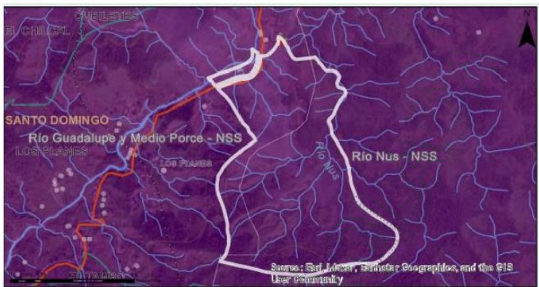
Imagen 5. Zonificación Ambiental – Geo-portal.

En groso modo analizando las determinantes ambientales de esta área de interés, abarcando el predio del señor Guillermo León Ríos Escobar, Identificado con C.C 70.138.187, se determina que: