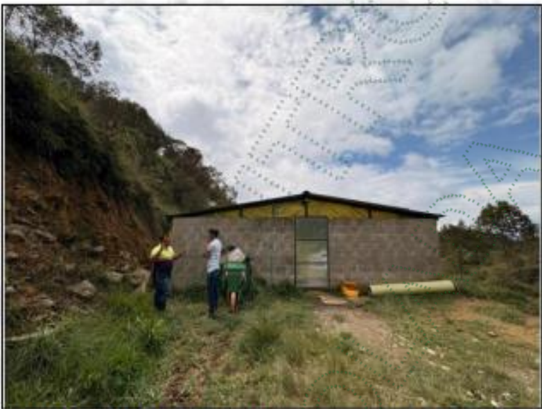
Imagen 2. Actividad Porcicola – Guillermo León Ríos

actividad Porcicola del señor Guillermo León Ríos Escobar, identificado con C.C 70.138.187. La cual no dio recorrido por los establos.