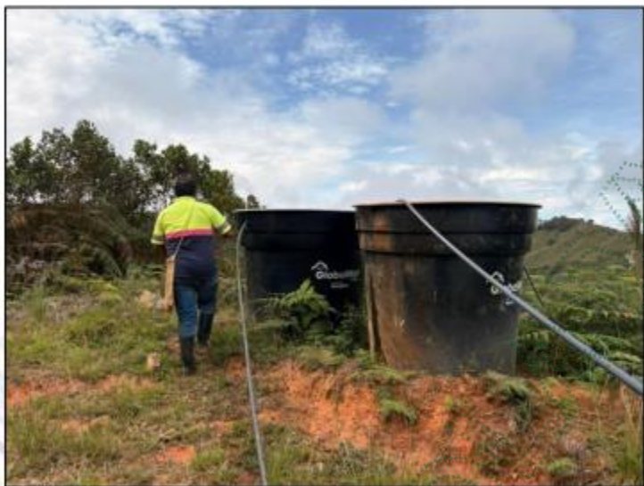
Imagen 7. Tanque de almacenamiento – Actividad Porcicola.

tiene su propia captación, la cual la almacenan en tanques de almacenamiento de 2000 litros, uno en funcionamiento y el otro como alternativa o en su defecto como emergencia, con coordenadas: 6 30 49.67 -75 9 25.84.