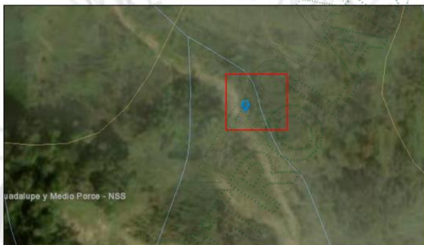
Imagen 6. Presencia de cuerpo de agua – Geo portal.

Nota: por condiciones del terreno y la densidad vegetal, no se logró identificar la tubería que descarga al cuerpo de agua que ilustra la imagen 6