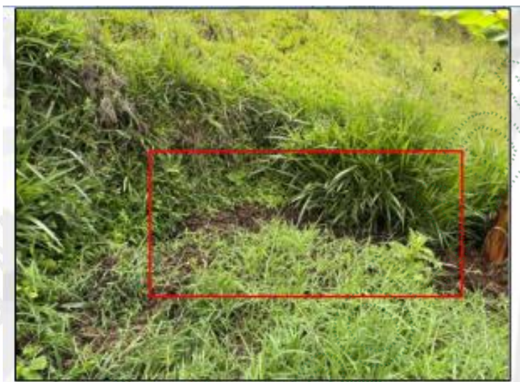
Imagen 4. Condiciones de la compostera.

En cuanto al manejo de la porcínaza sólida, se evidencia una gestión inadecuada, ya que en campo no se cumplen las condiciones mínimas requeridas. El material se encuentra dispuesto a cielo abierto, lo que lo hace susceptible al arrastre por escorrentías en temporada de lluvias, posibles vectores y, en contraposición, a deteriorarse por las condiciones adversas durante la época seca.