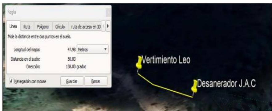
Imagen 5. Distancia de vertimiento de la actividad porcícola de Leo Ríos.