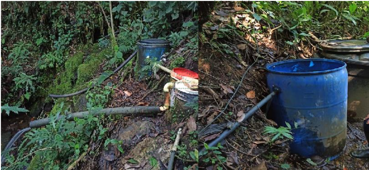
Imagen 2. Desarenadores y tanque de almacenamiento de 250 L de capacidad en polietileno.

Adicionalmente, se instalaron dos tanques que funcionan como desarenadores antes y después de la obra de derivación con capacidad de 250 litros cada uno; así mismo se evidencia la instalación de un tanque de almacenamiento en el mismo punto de captación, como se detalla a continuación.