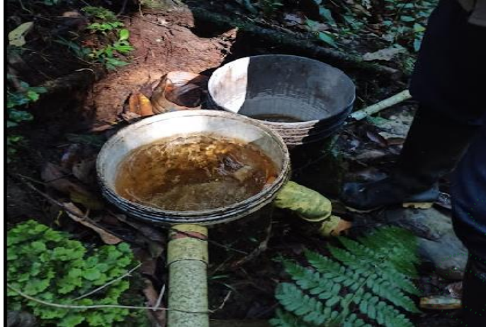
Imagen 1. Obra de captación y derivación de caudales-Diseño Económico.

Adicionalmente, se instalaron dos tanques que funcionan como desarenadores antes y después de la obra de derivación con capacidad de 250 litros cada uno; así mismo se evidencia la instalación de un tanque de almacenamiento en el mismo punto de captación, como se detalla a continuación.