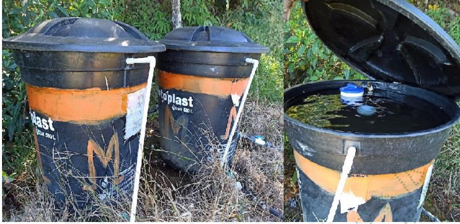
Imagen 3. Tanques de almacenamiento instalados en el predio Mayagüey.

En cuanto al permiso de vertimientos, fue otorgado por medio de la resolución RE-05043 del 23 de diciembre de 2022 y reposa en el expediente 057560440536.