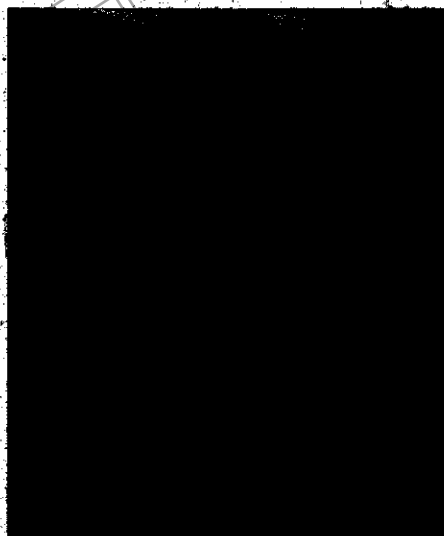
Sitio de la Intervención