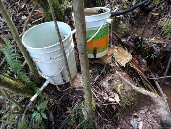
Imagen # 1 obra de control de caudal

Así mismo se verifican las demás obligaciones plasmadas en la resolución que otorga la concesión de aguas, constatando que se conservan las fajas de protección hídrica, se conserva el caudal ambiental exigido, no hay evidencia del consumo de altos volúmenes de insumos agroquímicos que afecten la fertilidad de los suelos o contaminen cuerpos de agua en área de influencia de la actividad agrícola.