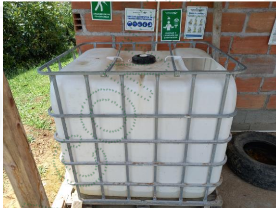
Imagen # 3 Dispositivo para mezcla de productos