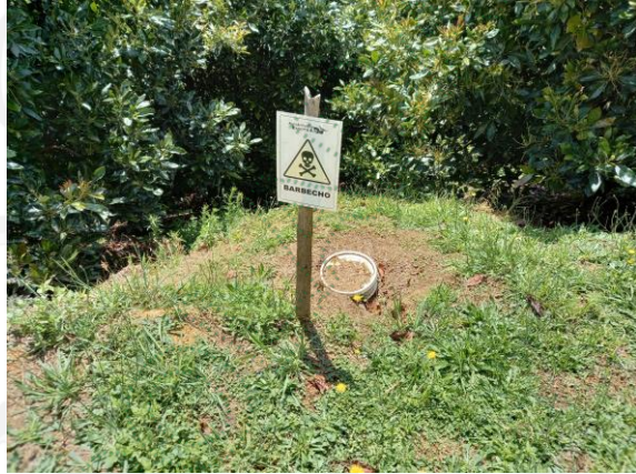
Imagen # 2 Pozo de desactivación