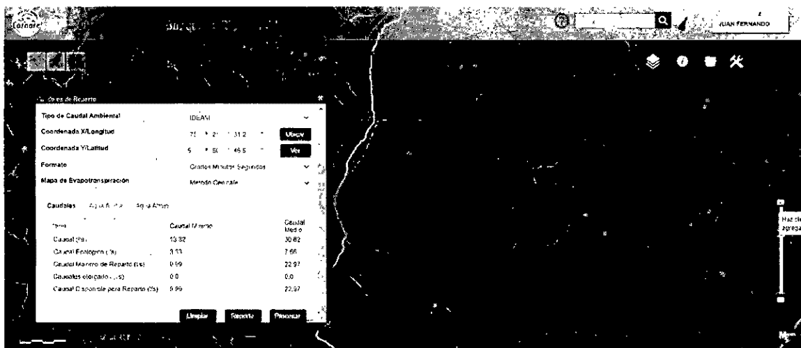
Caudales de reparto fuente La Pradera.

3.9 En la figura que se muestra a continuación se observa los caudales de reparto según el Geoportal corporativo: