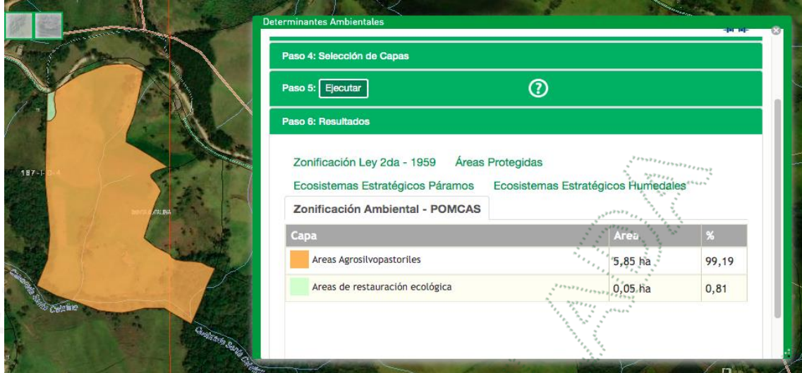
Imagen 2. Determinantes Ambientales Predio FMI 002-10583

b) De acuerdo a la consulta realizada sobre la capa de la Zonificación Ambiental – POMCAS, el predio identificado con FMI 002-10583, se encuentra ubicado dentro de los límites del Plan de Ordenamiento y Manejo de la Cuenca Hidrográfica (POMCA) del Río Arma. En el predio, el 99.19% (5.85 Ha) se encuentra en Áreas Agrosilvopastoriles y el 0.81% (0.05 Ha) son Áreas de Restauración Ecológica.