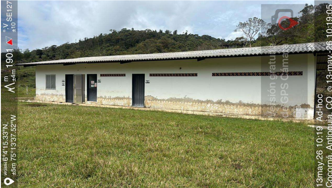
Imagen 1: Antiguas instalación del procesamiento de la uchuva

En consecuencia, se verificó que el recurso hídrico derivado de la fuente concesionada actualmente está siendo destinado exclusivamente para uso doméstico, asociado al abastecimiento de la vivienda existente en el predio, la cual es habitada de manera permanente por dos (2) personas. En este sentido, se evidencia una modificación sustancial en las condiciones de uso inicialmente contempladas dentro del permiso de concesión de aguas, reduciéndose significativamente la demanda hídrica previamente asociada a actividades agropecuarias de carácter transitorio.