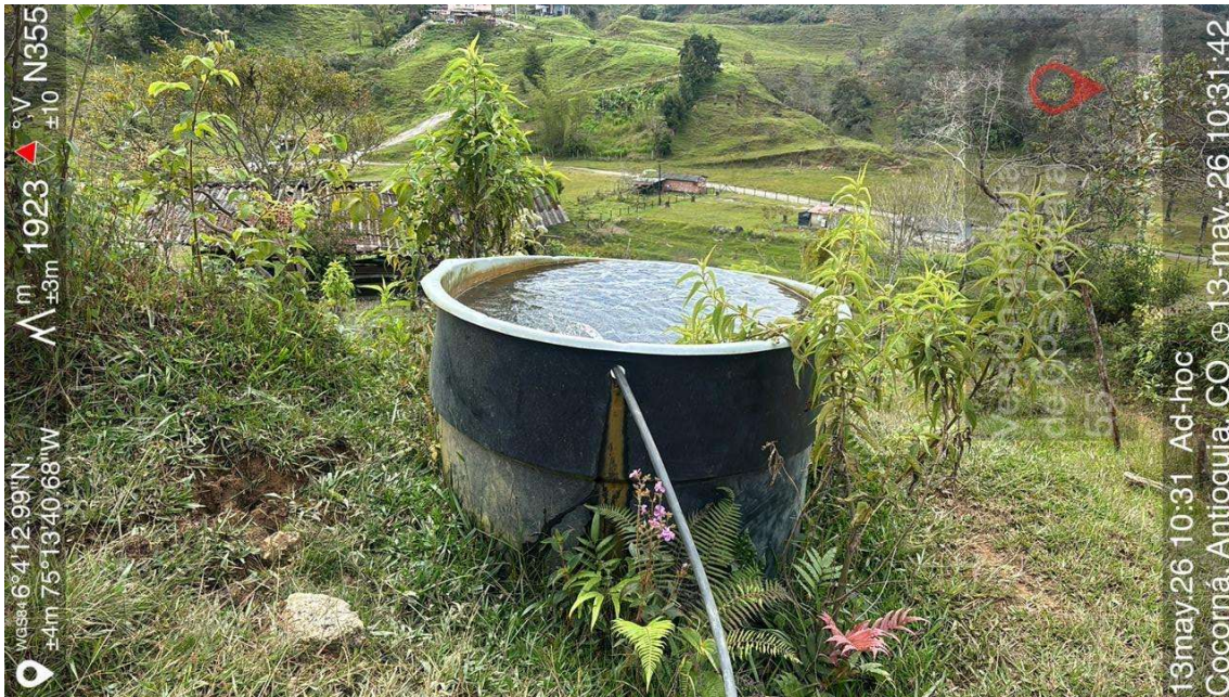
Imagen 1: tanque de almacenamiento del predio.

Durante el recorrido, no se evidenció la existencia de captación y control del caudal concesionado, conforme a los lineamientos establecidos por la Autoridad Ambiental para este tipo de aprovechamientos. En campo únicamente se observó una captación directa mediante una estructura artesanal consistente en una tubería de dos (2) pulgadas instalada sobre la fuente hídrica, la cual reduce posteriormente su diámetro a una (1) pulgada para conducir el recurso hídrico derivado hacia un tanque de almacenamiento con capacidad de 2.000 litros.