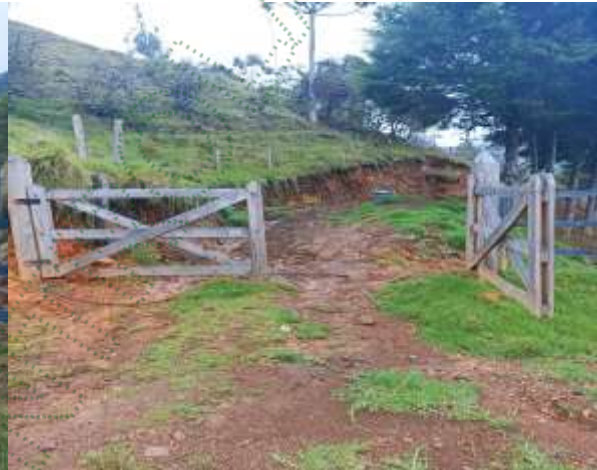
Entrada para el lote afectado