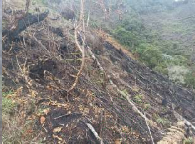
Tala y quema de bosque