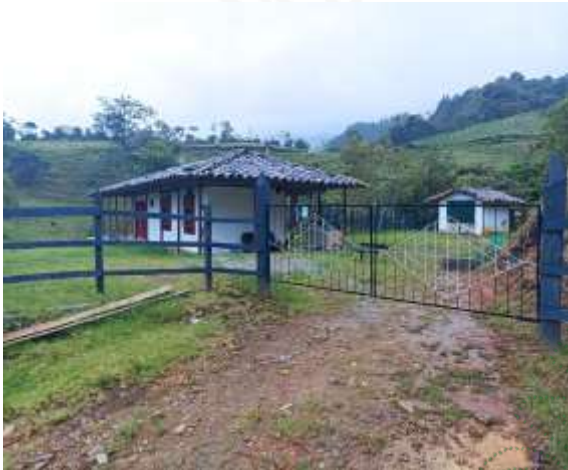
Casa de Hernán Ocampo (presunto infractor)