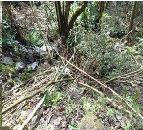
Tala de bosque nativo