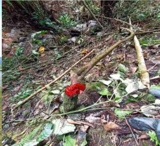
Tala de bosque nativo