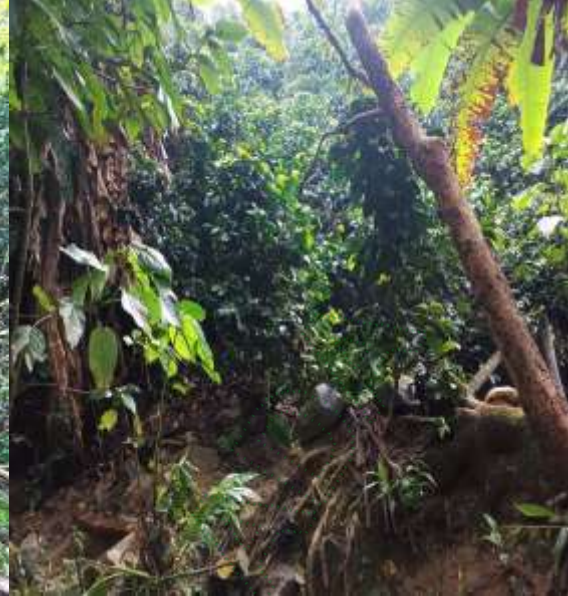
Cultivos de Café, Plátano y Banano en ronda hídrica