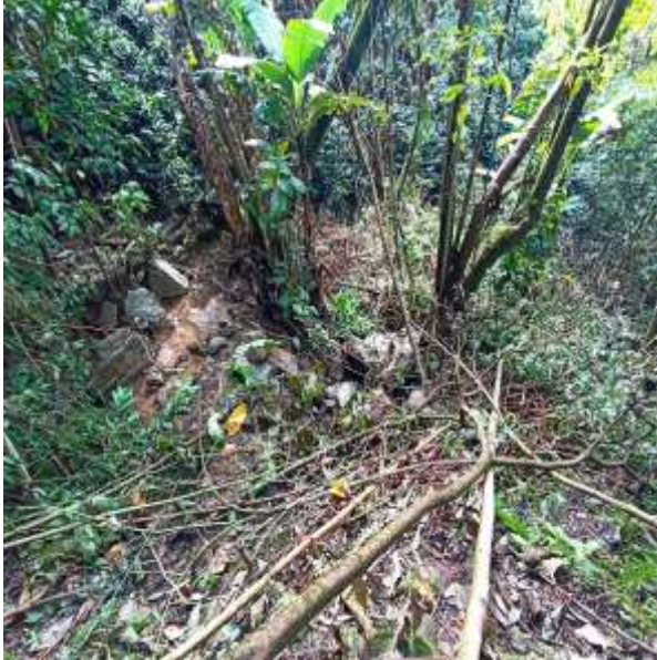
Tala de bosque nativo en ronda hídrica