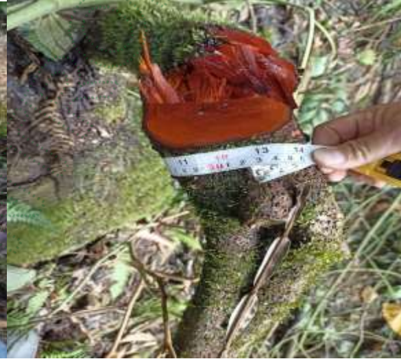
Árboles talados con 25 y 32 centímetros de diámetro