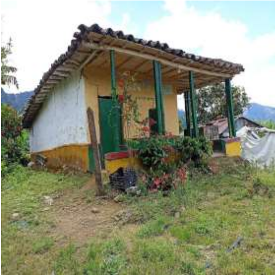
Casa de Antonio Osorio (presunto infractor)