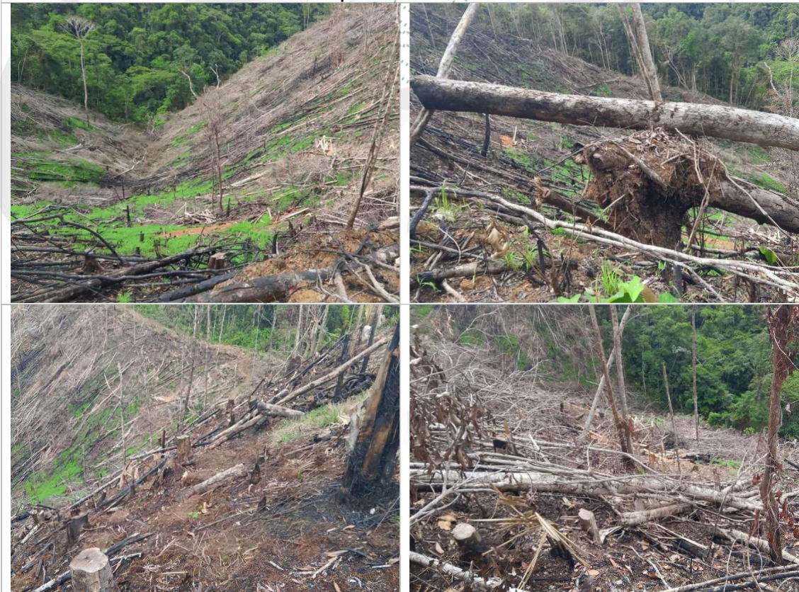
Tala rasa de 3 ha en el predio con PK 6602002000001200020.