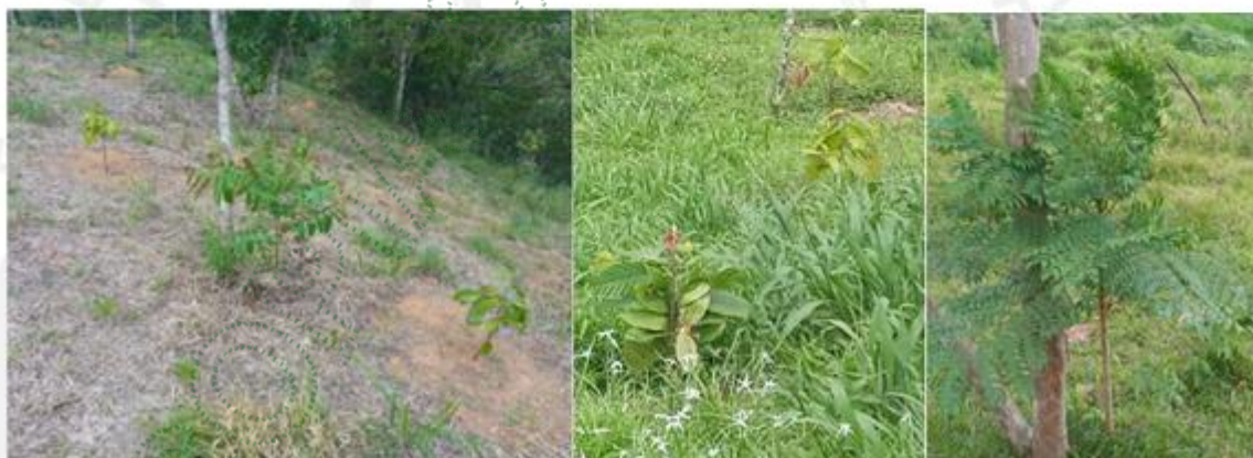
Siembra de árboles frutales y maderables en compensación en áreas con potreros para su restauración