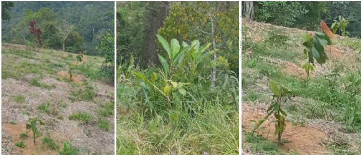
Siembra de árboles frutales y maderables en compensación en áreas con potreros para su restauración

En las siguientes fotos se muestran uno de los tocones de los árboles aprovechados, el área donde se realizó la siembra y algunas de las especies sembradas como compensación: