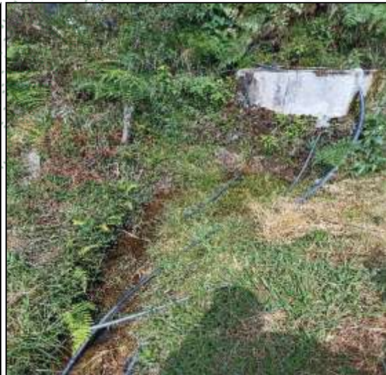
Toma del agua y arroyo