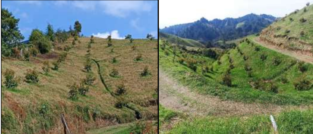
Cultivo de Aguacate predio de los hermanos Giraldo Ospina