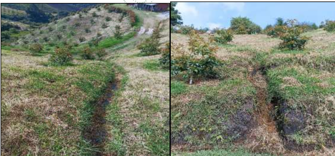
Arroyo sin protección y con cultivo sembrado a menos de 2 metros