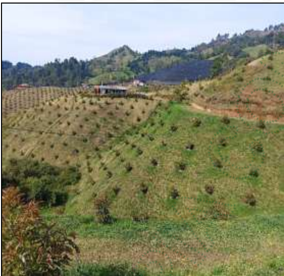
Predio de los señores Giraldo Ospina