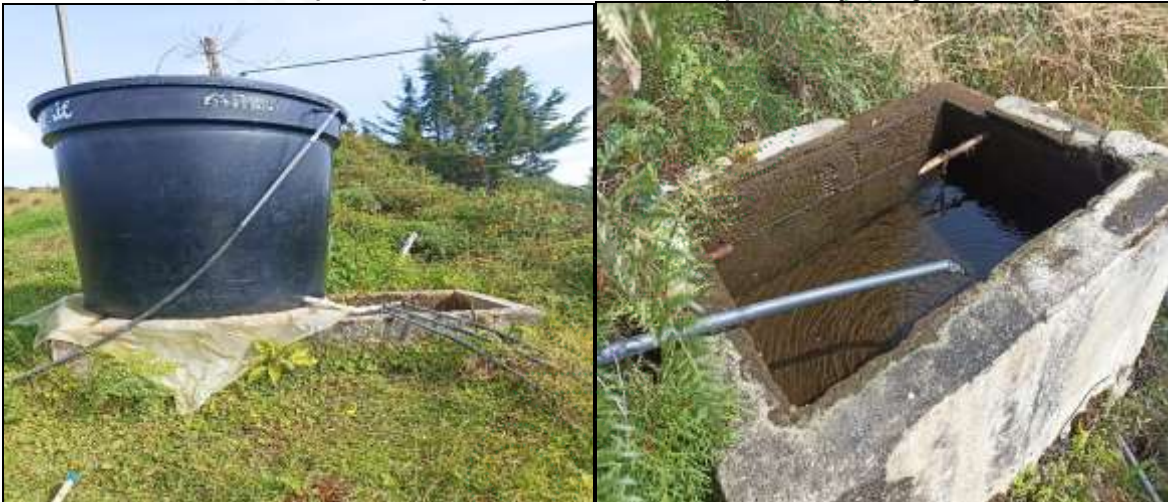
Tanque comunitario Casa de Cartón