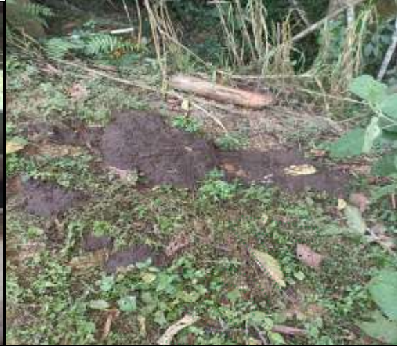
Excretas sólidas depositadas en ladera cerca a la fuente