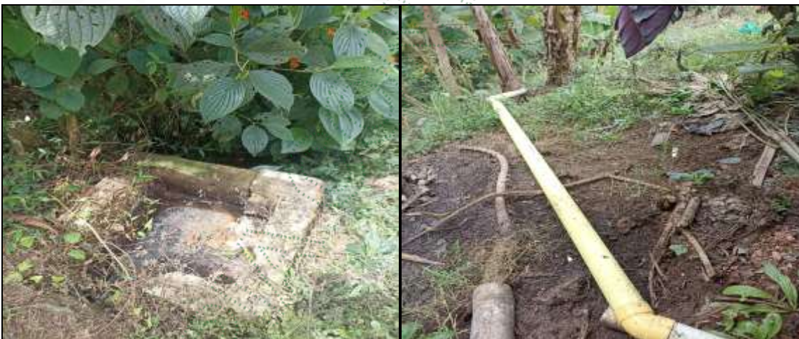
Salida aguas residuales de baño y cocina