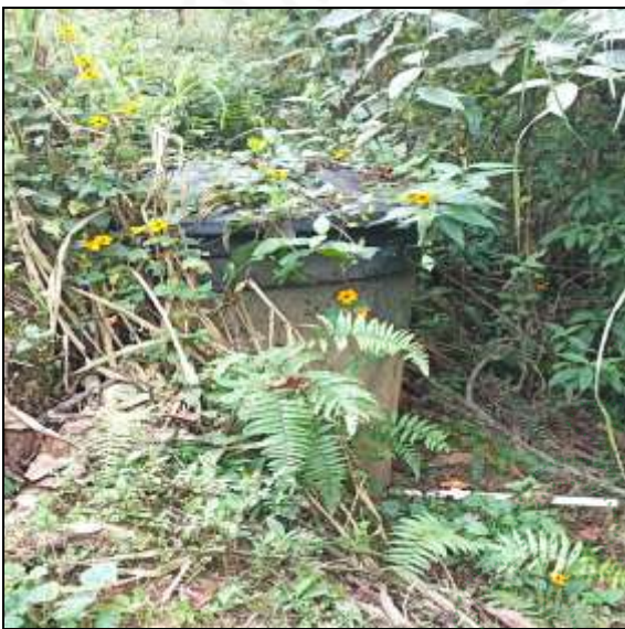
Tanque séptico sin funcionamiento