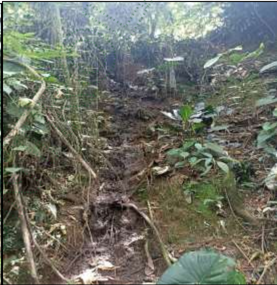
Rastro del vertimiento de aguas residuales en la fuente