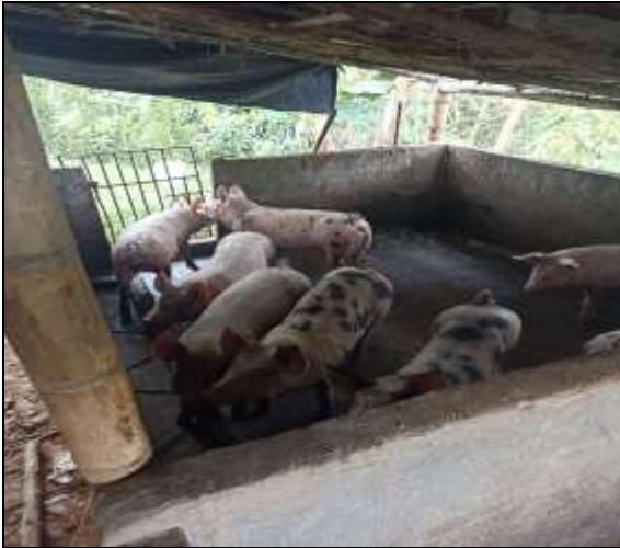
Cocheras sucias, con malos olores y moscas