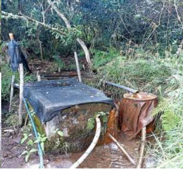
Obra de captación en el nacimiento (Izquierda Los Ocampo - Derecha otras familias)