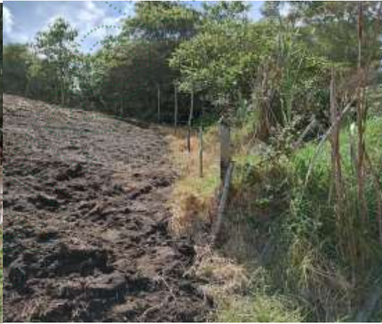
Predio Alfonso Ocampo