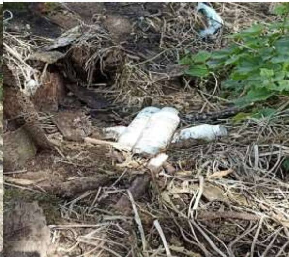
Envases de agroquímicos en ronda hídrica Predio Miguel Antonio Ocampo