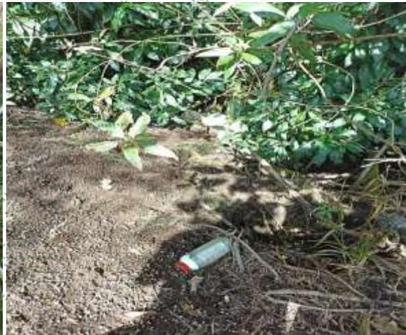
Envase de agroquímico en ronda hídrica Predio Alfonso Ocampo