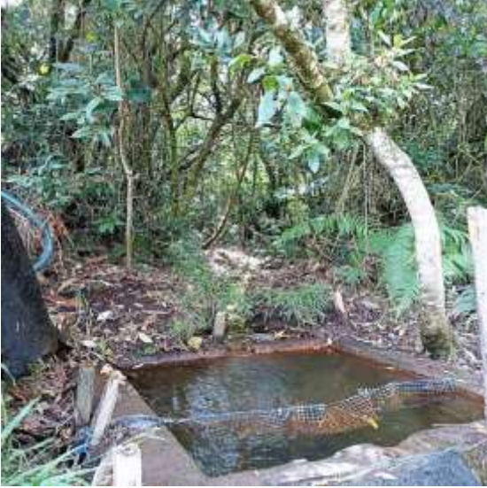
Nacimiento El Hoyo - Los Ocampo