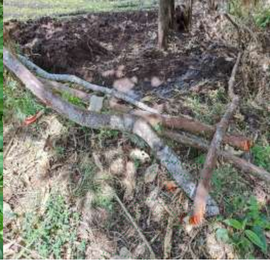
Árboles talados en ronda hídrica Predio Miguel Antonio Ocampo