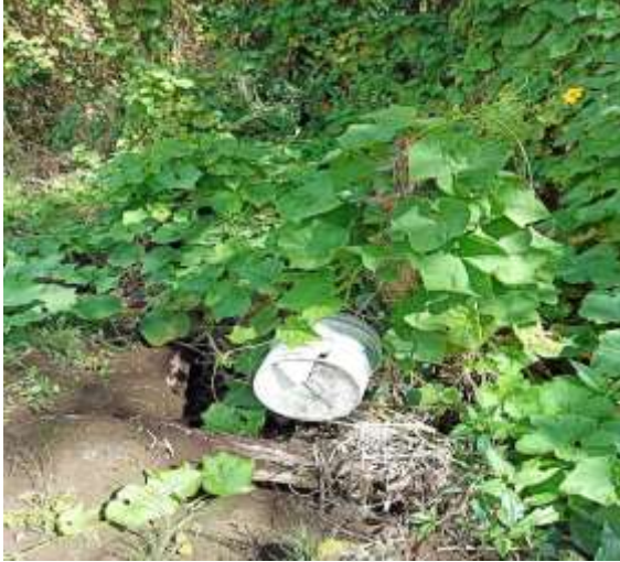
Recipiente (balde plástico) ronda hídrica Predio Miguel Antonio Ocampo