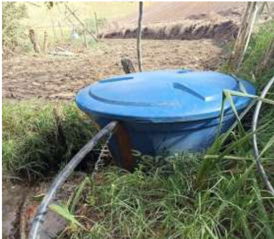
Tanque de almacenamiento Los Ocampo (en la fuente)