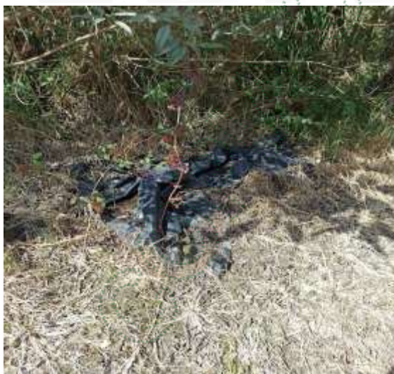
Residuos de polietileno en ronda hídrica Predio Alfonso Ocampo