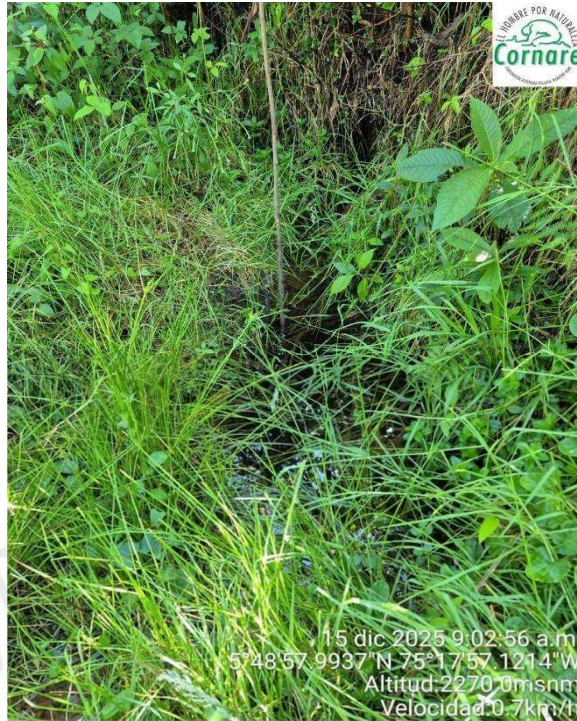
Imagen 2. Punto de captación.

Durante la visita se evidenció la presencia de un pozo séptico, el cual, según lo informado, es de fibra de vidrio. No se percibieron olores ofensivos o rupturas del sistema.