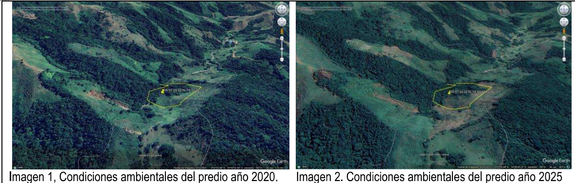
Imagen 1, Condiciones ambientales del predio año 2020.