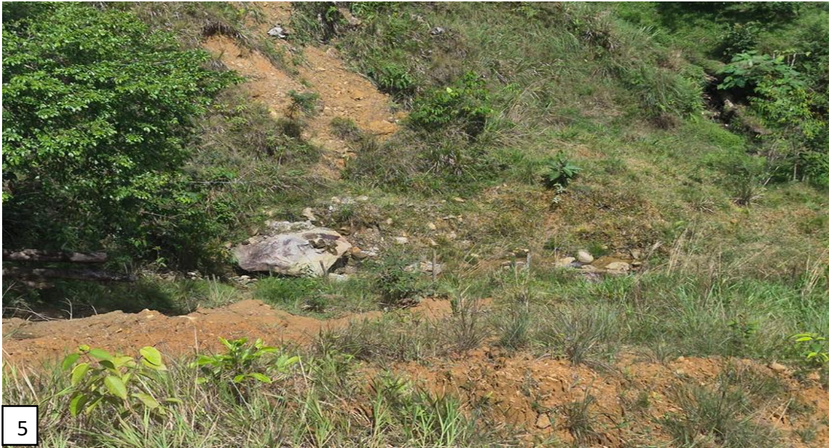
Imagen 5. Fuente hídrica denominada “sin nombre”, localizada en las coordenadas geográficas -75^{\circ}06'13.49'' W, 06^{\circ}00'56.83'' N.