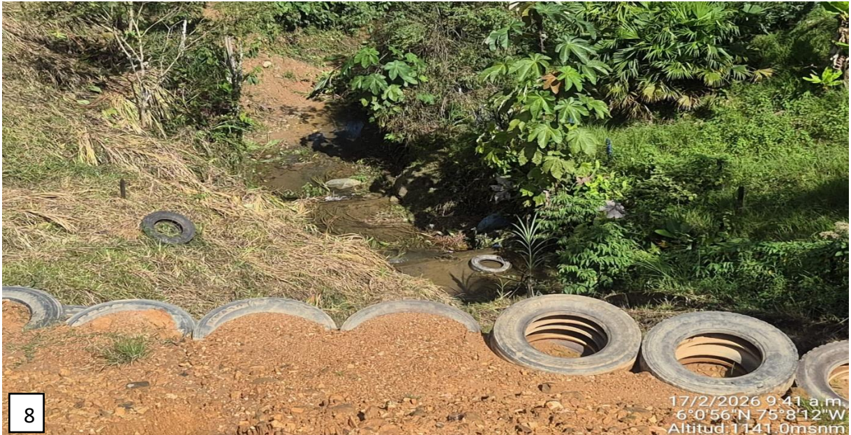
Imagen 8. Fuente hídrica ubicada en las coordenadas geográficas -75^{\circ}08'12.34'' W, 06^{\circ}00'56.65'' N, con procesos de sedimentación y con signos de contaminación asociados a los residuos provenientes del trincho en construcción con llantas.