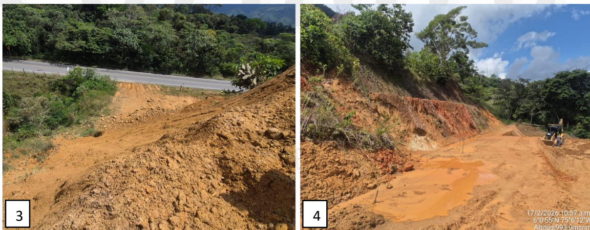
Imagen 3. Talud de relleno, Imagen 4. Talud de corte