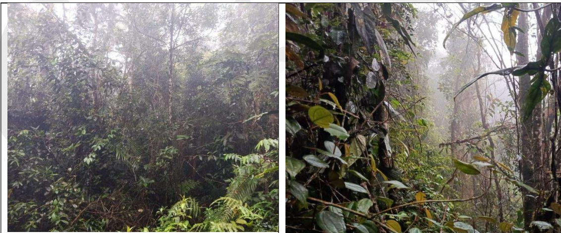
Imágenes 1 y 2. Regeneración natural en área de interés. Cornare 2026