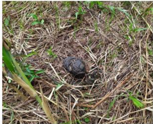
Estiercol de ganado a escasos dos metros de la fuente, aguas arriba de la captación.