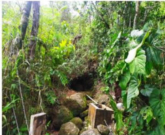
Captación de agua sobre la fuente, a un lado del potrero.