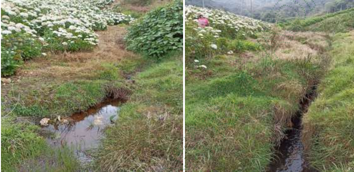
Sitio de afectación: fuente La Cascada. Cultivo a menos de 2 metros de la fuente