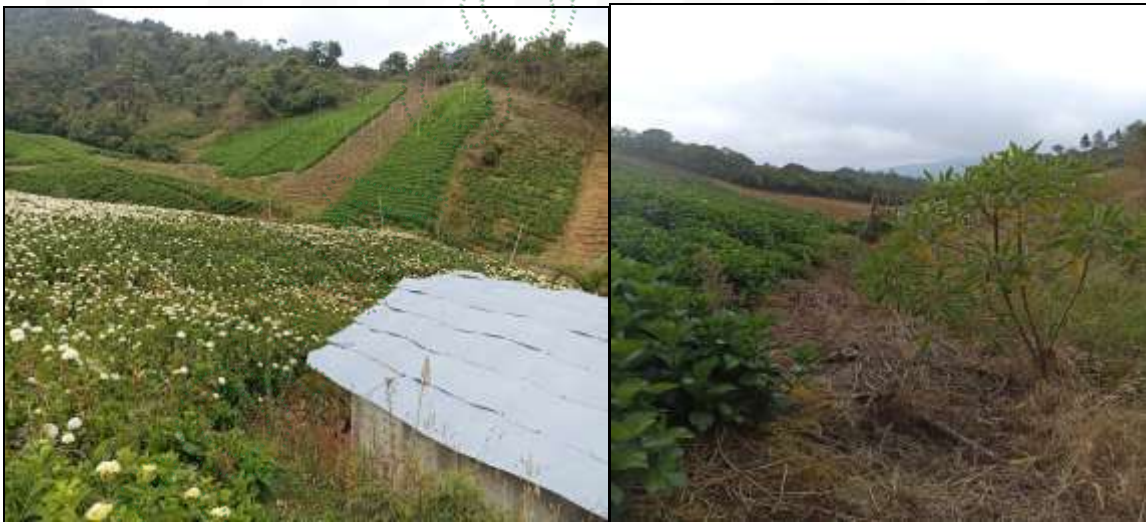
Cultivo de hortensia cercano a la fuente