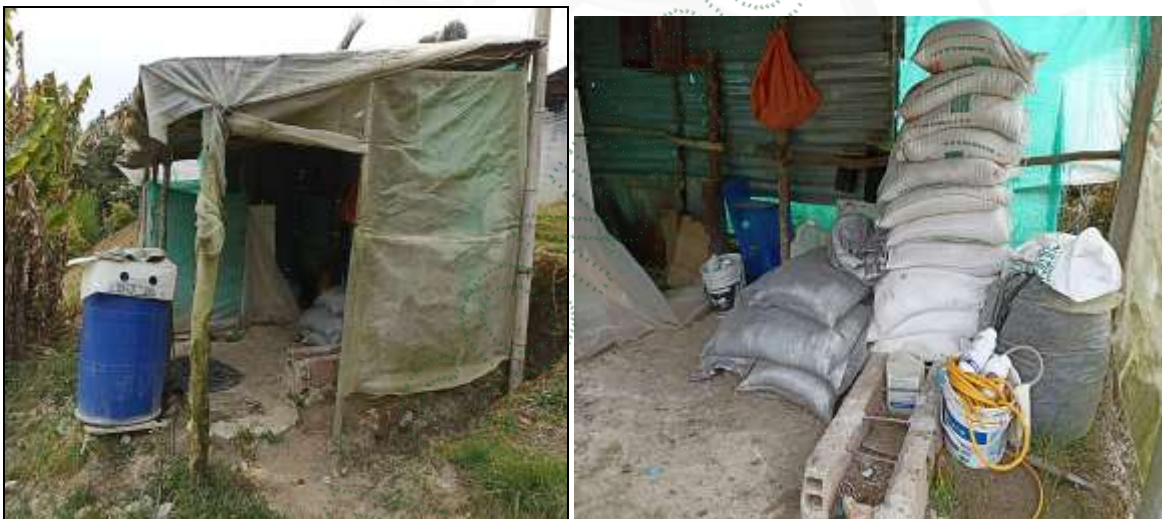
Lugar de preparación de agroquímicos y lavado de ubicado a 10 metros de la vivienda