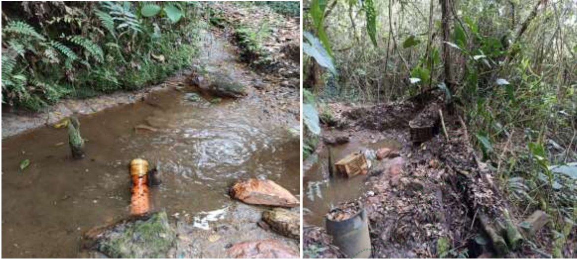
Punto de captación del agua