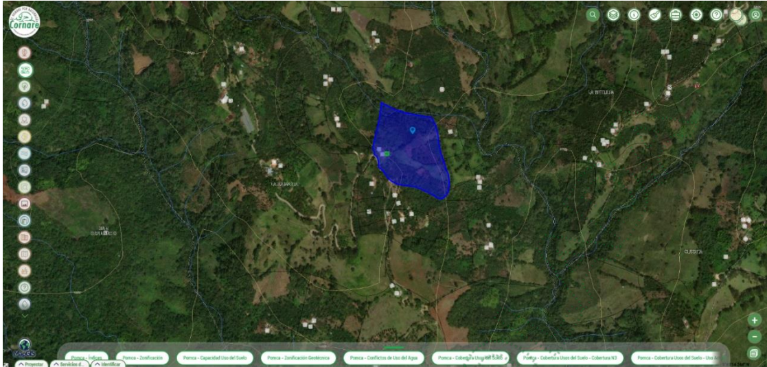
Imagen 1 tomada del Geoportal MapGis de Cornare.