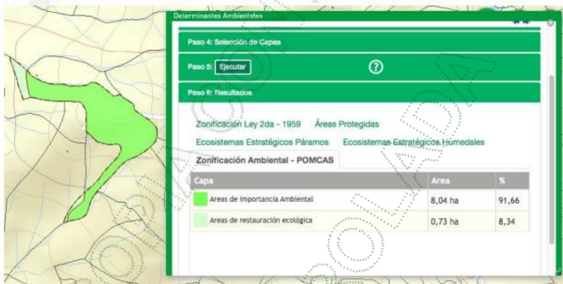
Imagen 2. Determinantes Ambientales Predio FMI 002-1536