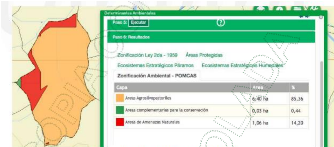
Imagen 2. Determinantes Ambientales Predio FMI 028-30599 Fuente. Geoportal interno de Cornare