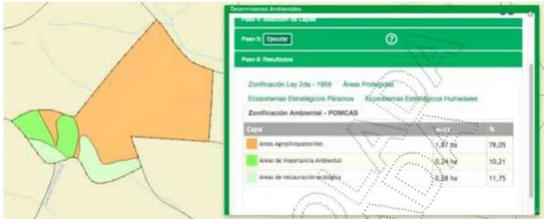
Imagen 2. Determinantes Ambientales Predio FMI 002-5635

dentro de las áreas agrosilvopastoriles, el 10.21% (0.24 Ha) son áreas de importancia ambiental y el 11.75% (0.28 Ha) son áreas de restauración ecológica.