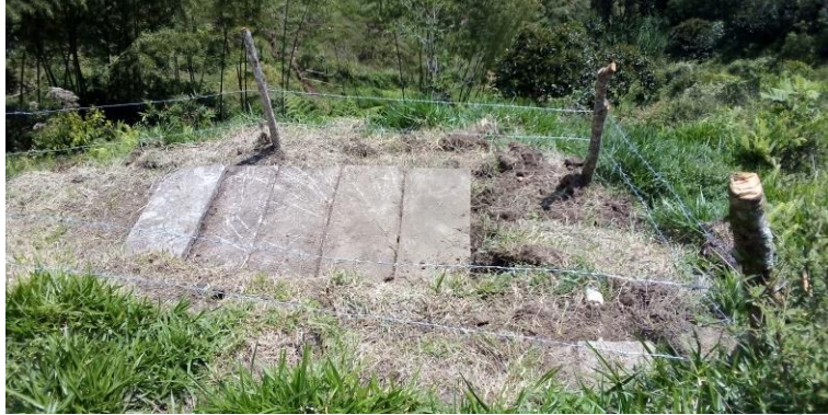
Fotos del sitio del pozo séptico que hay en el predio.