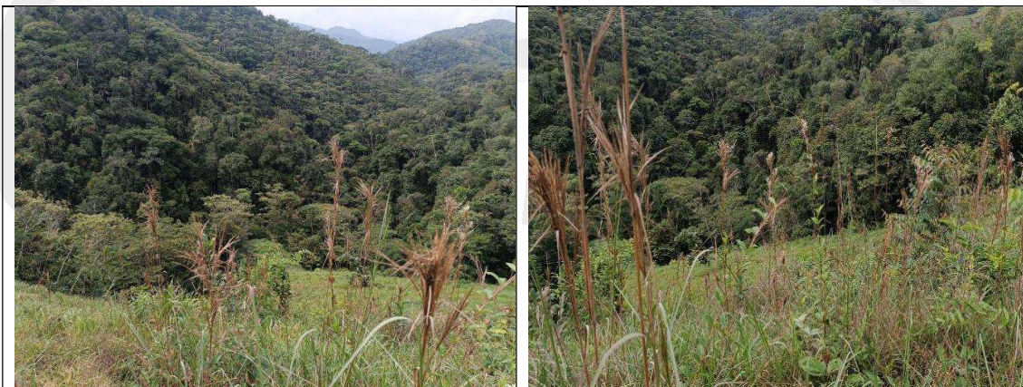
Imágenes 2, y 3 Estado actual del predio