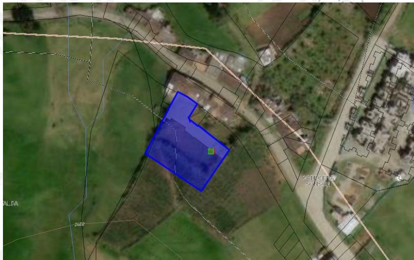
Imagen 1: Ubicación del predio.

3.3 Para llegar al predio se toma la vía que desde el parque principal del municipio de Sonsón conduce al barrio El Tapete, tomando la calle 7 hasta llegar al predio con nomenclatura calle 7 # 13-11, el cual es usado como parqueadero y lavadero de vehículos. El punto de captación se encuentra a 400 metros aproximadamente continuando por carretera destapada hacia vereda Llanadas Arriba.