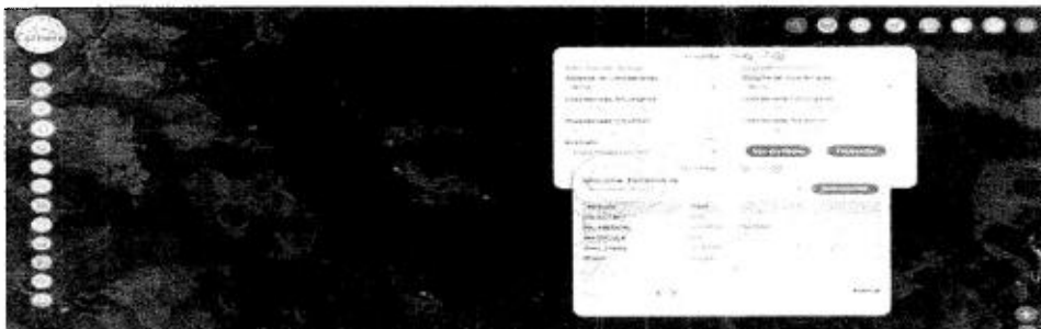
Figura 1. Georreferenciación predio PK: 6522002000001600015