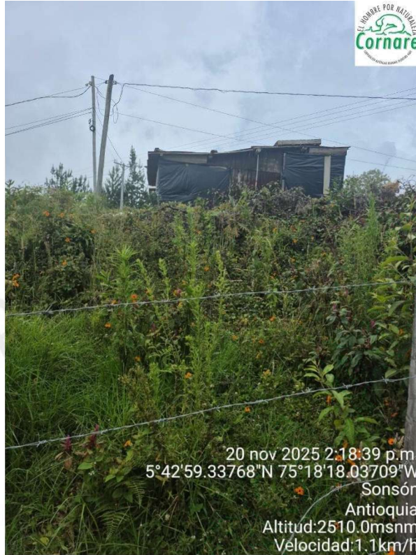
Imagen 2. Punto de afectación.