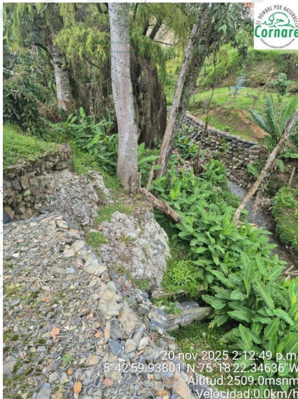
Imagen 3. Implementación de Cevinos y muros de contención