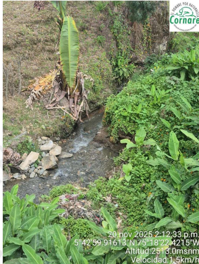
Imagen 4. Fuente hídrica sin sedimentos.