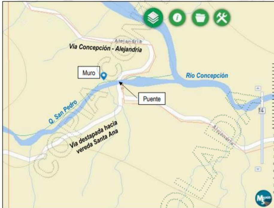
Figura 1. Localización de la zona de estudio.