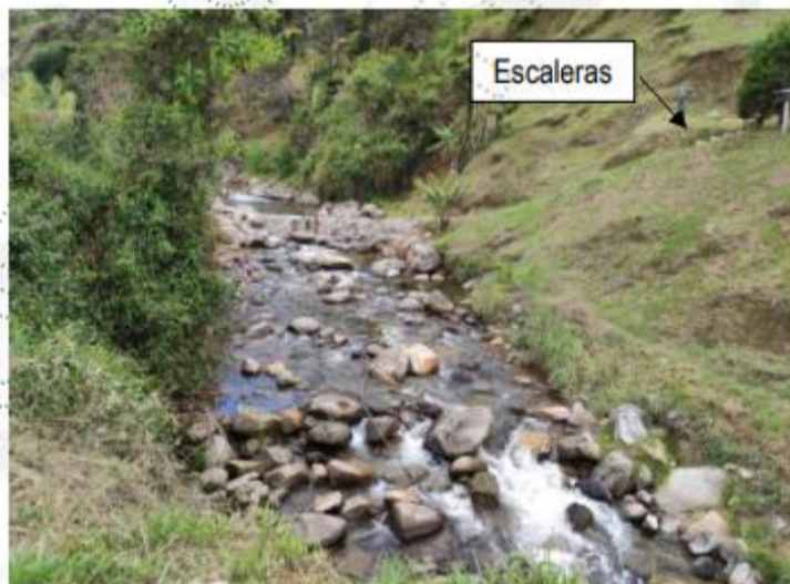
Foto 3. Escaleras de acceso a la zona del muro en el predio de Lina Henao.