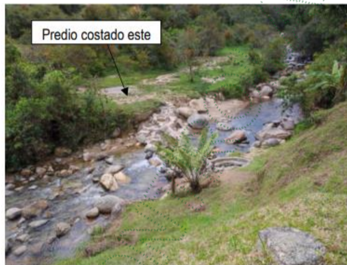
Foto 4. Predio en el costado este de la quebrada San Pedro.