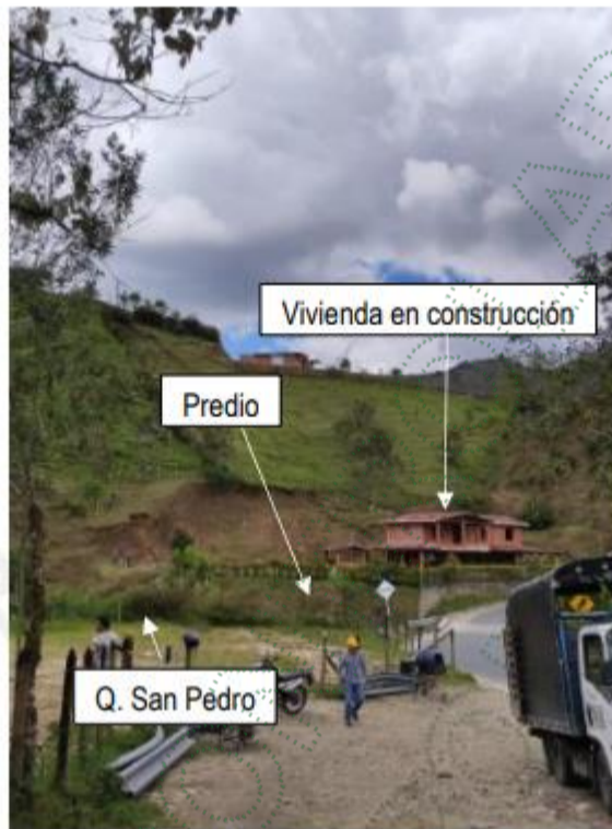
Foto 2. Predio costado oeste de la quebrada San Pedro.

En el predio del costado oeste se observa la construcción de una vivienda de dos niveles y de unas escaleras para el descenso a la quebrada en donde se localiza el muro. (Ver Foto 2 y Foto 3). Por otro lado, el predio localizado en el costado este (Foto 4) corresponde a un terreno asociado a la llanura de inundación de la fuente hídrica y en él no se observan viviendas ni ningún otro tipo de construcción, tampoco se observan actividades agropecuarias.