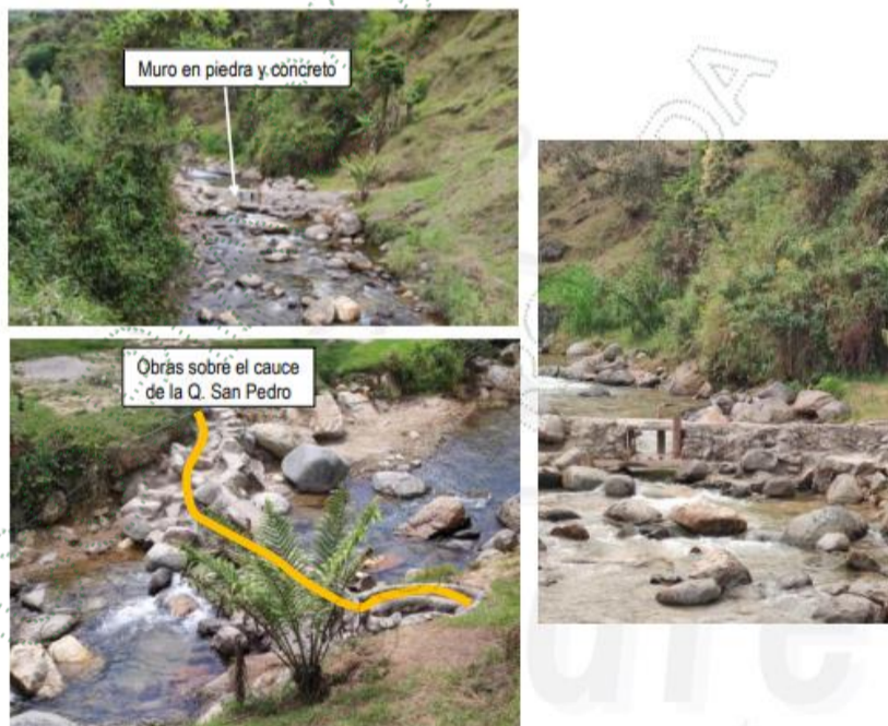
Foto 1. Muro construido sobre la quebrada San Pedro.

Durante la visita técnica realizada el día 23 de enero del año 2023, se realizó verificación de las condiciones de la quebrada San Pedro en el sitio de estudio. Allí se encontró que, sobre el cauce del mismo, de manera transversal se encuentra construido un muro en piedra y concreto con un ancho de máximo 1 m y una longitud de 15 m.