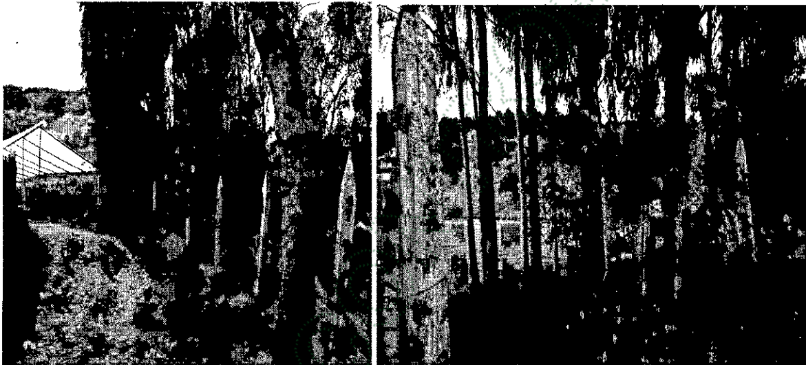
Sitio donde se realizó siembra de árboles nativos como compensación.