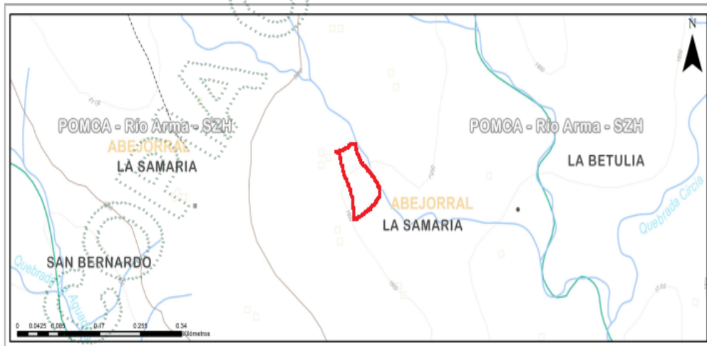
Imagen 1 tomada del Geoportal MapGis de Cornare.