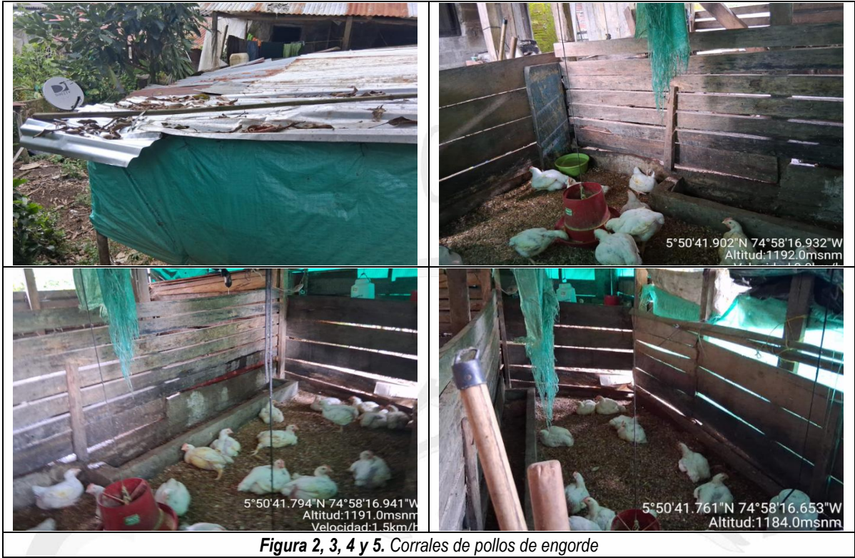
Figura 2, 3, 4 y 5. Corrales de pollos de engorde

25.3 Se permitió el ingreso del personal al predio, donde se evidenciaron corrales destinados al levante de pollos de engorde, actividad que — según indicó el señor Jairo— se realiza a pequeña escala y con fines de subsistencia. No se observaron cocheras para la cría de cerdos; por lo anterior, no se genera vertimiento alguno hacia la fuente hídrica. (ver figura 2, 3, 4 y 5).