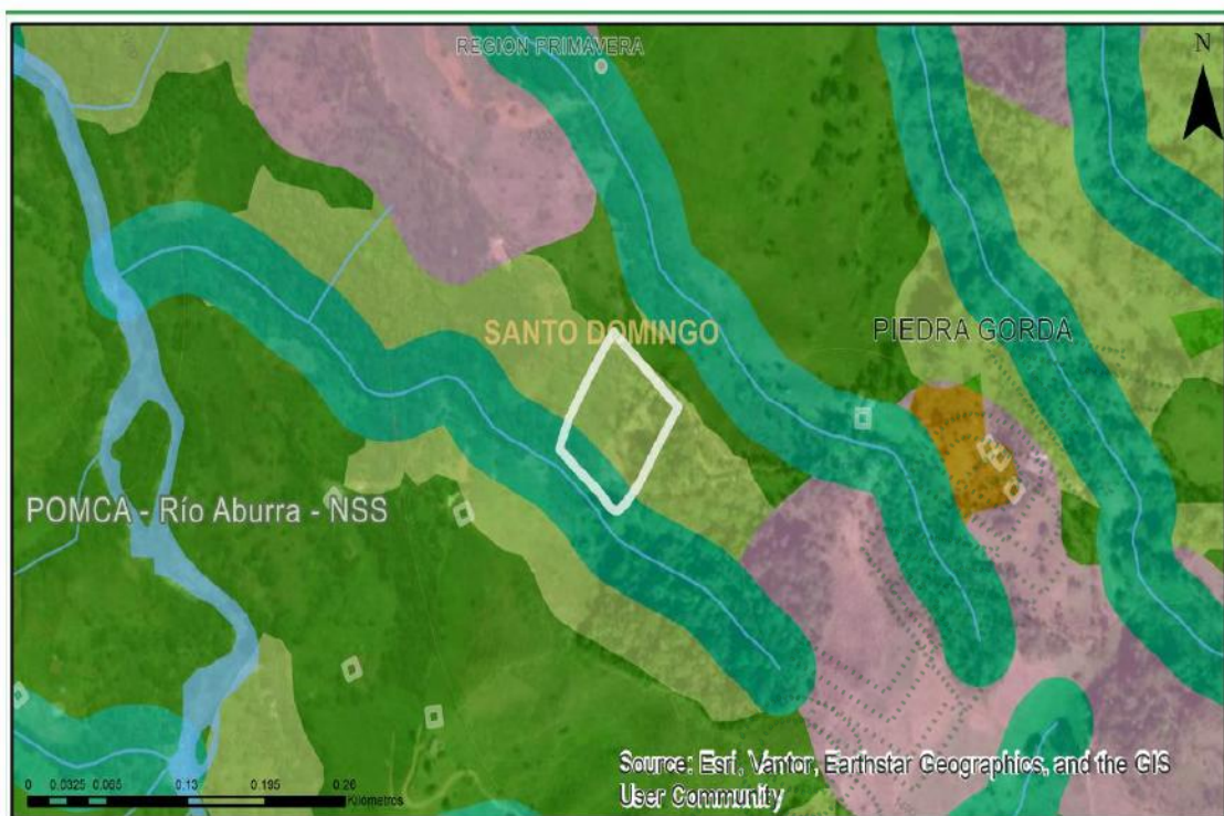
Imagen 5. Zonificación Ambiental – Geo-portal.