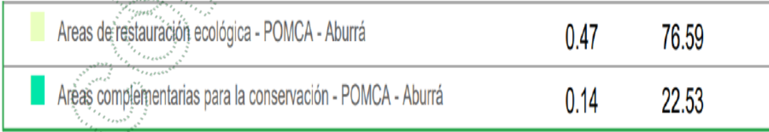
Imagen 4. Clasificaciones de Determinante ambientales.

Se consultó las determinantes ambientales. "se encuentra sujeto a restricciones dentro el ámbito de Plan de Ordenación y Manejo de la cuenca Hidrográfica (POMCA) del Rio aburra: del predio del señor "Ernesto Castellón Identificado con C.C Sin Dato", PK_PREDIOS: 6902005000000400112, ubicado en el municipio de Santo Domingo Corregimiento Botero, la cual se evidencia que el área está bajo varias clasificaciones tales como: