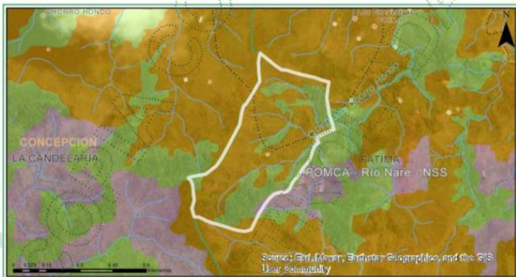
Imagen 3. Zonificación ambiental – Manuel Hoyos